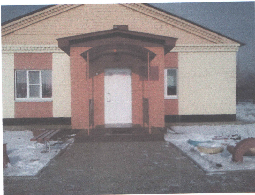
Вход в здание