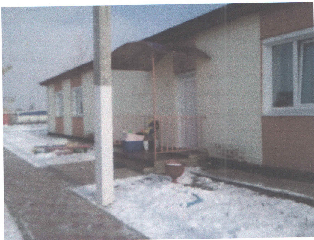
Фото № 2,3